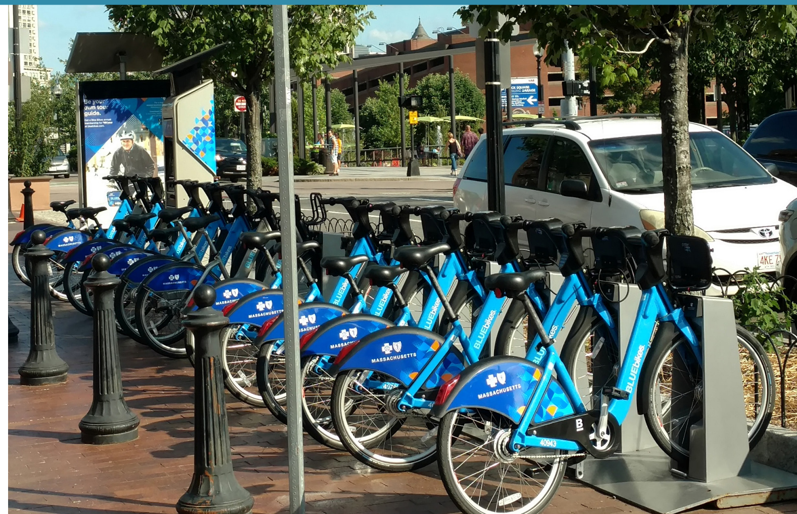
Bike Share Bicicletas compartidas

WHAT POTENTIAL MOBILITY AND SAFETY FEATURES WOULD YOU LIKE TO SEE IN THE FDC? USE THE STICKY DOTS TO CHOOSE YOUR TOP 3. ¿QUÉ CARACTERÍSTICAS POTENCIALES DE MOVILIDAD Y SEGURIDAD LE GUSTARÍA VER EN EL PLAN ESPECÍFICO DEL CENTRO DE DESARROLLO FAIRVIEW? USA LOS PUNTOS ADHESIVOS PARA ELEGIR TUS 3 MEJORES.