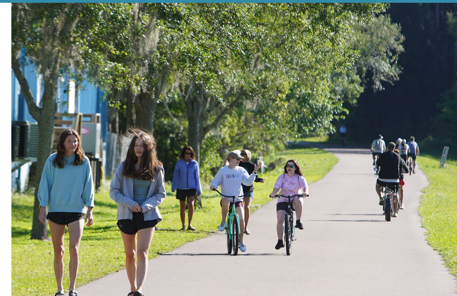
Trails and Walking Paths Senderos