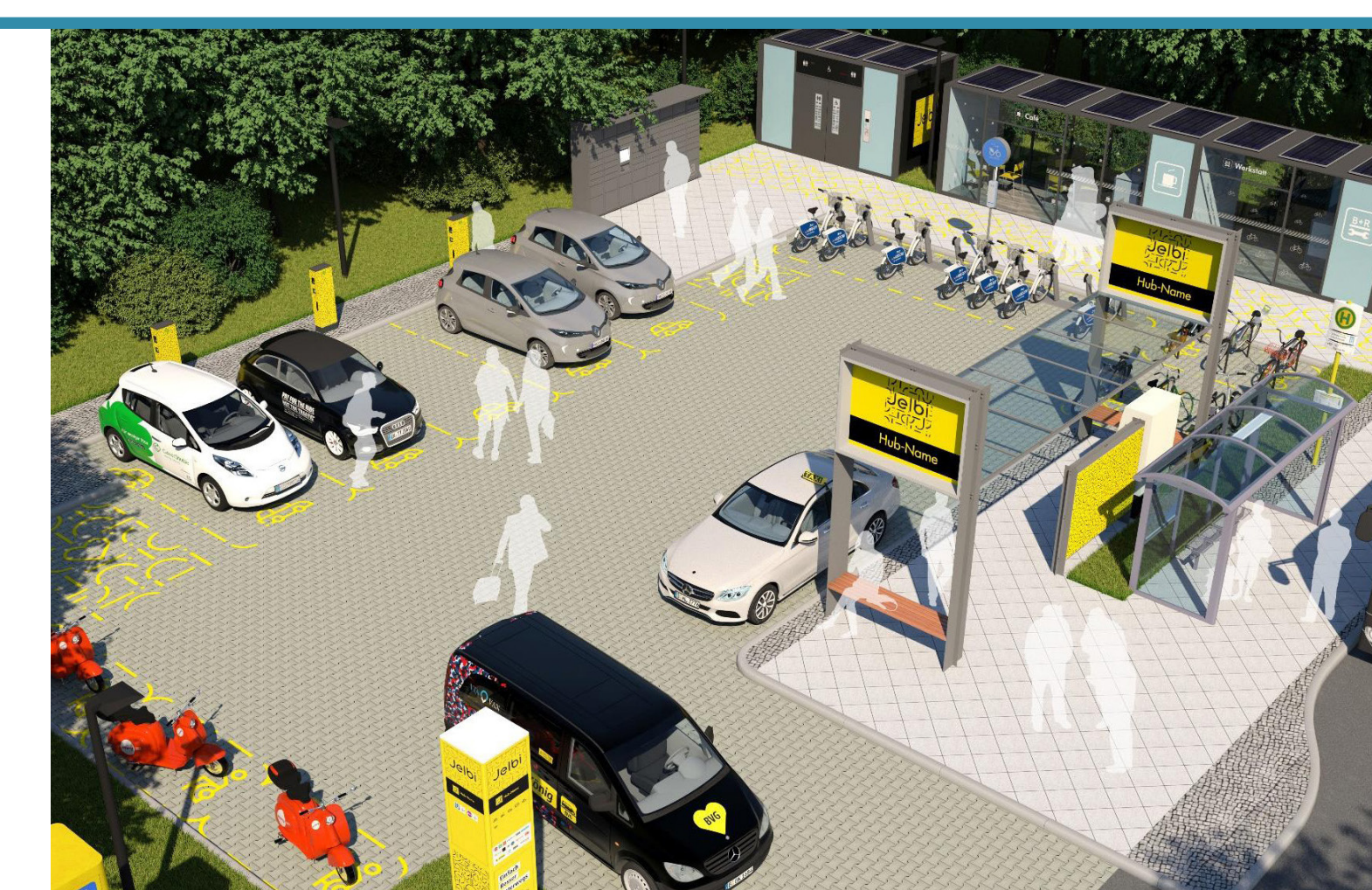
Mobility Hub Centro de movilidad