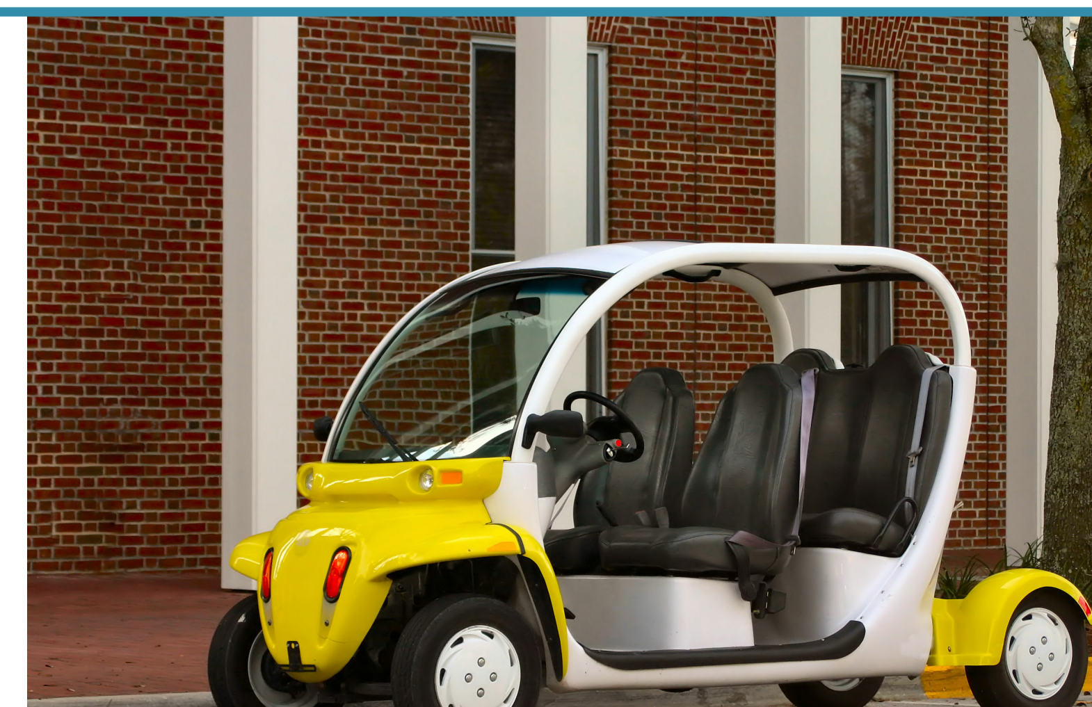
Neighborhood Electric Vehicles Vehículos eléctricos vecinales