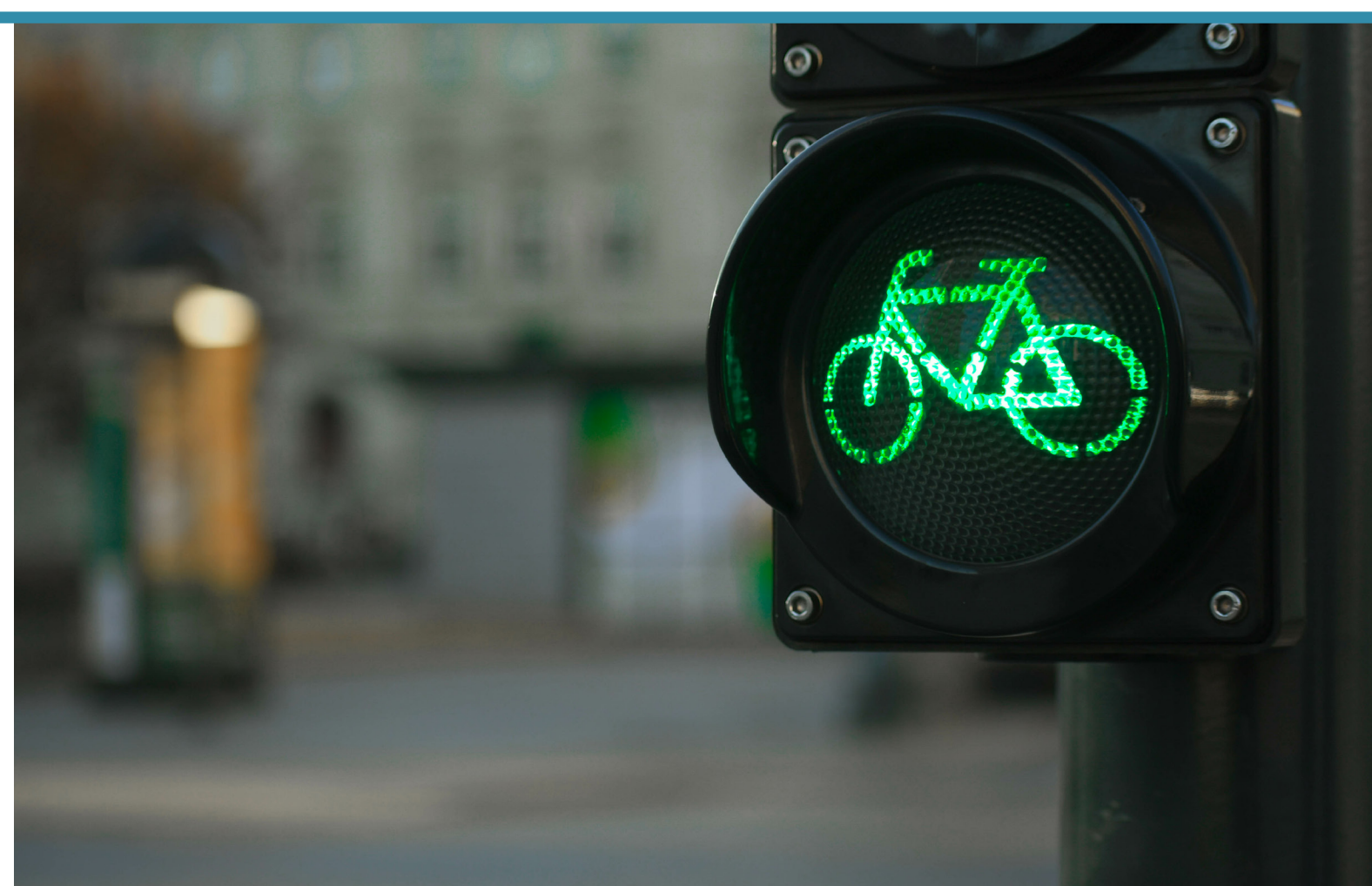
Bike Crossing Signals Señales de cruce de bicicletas