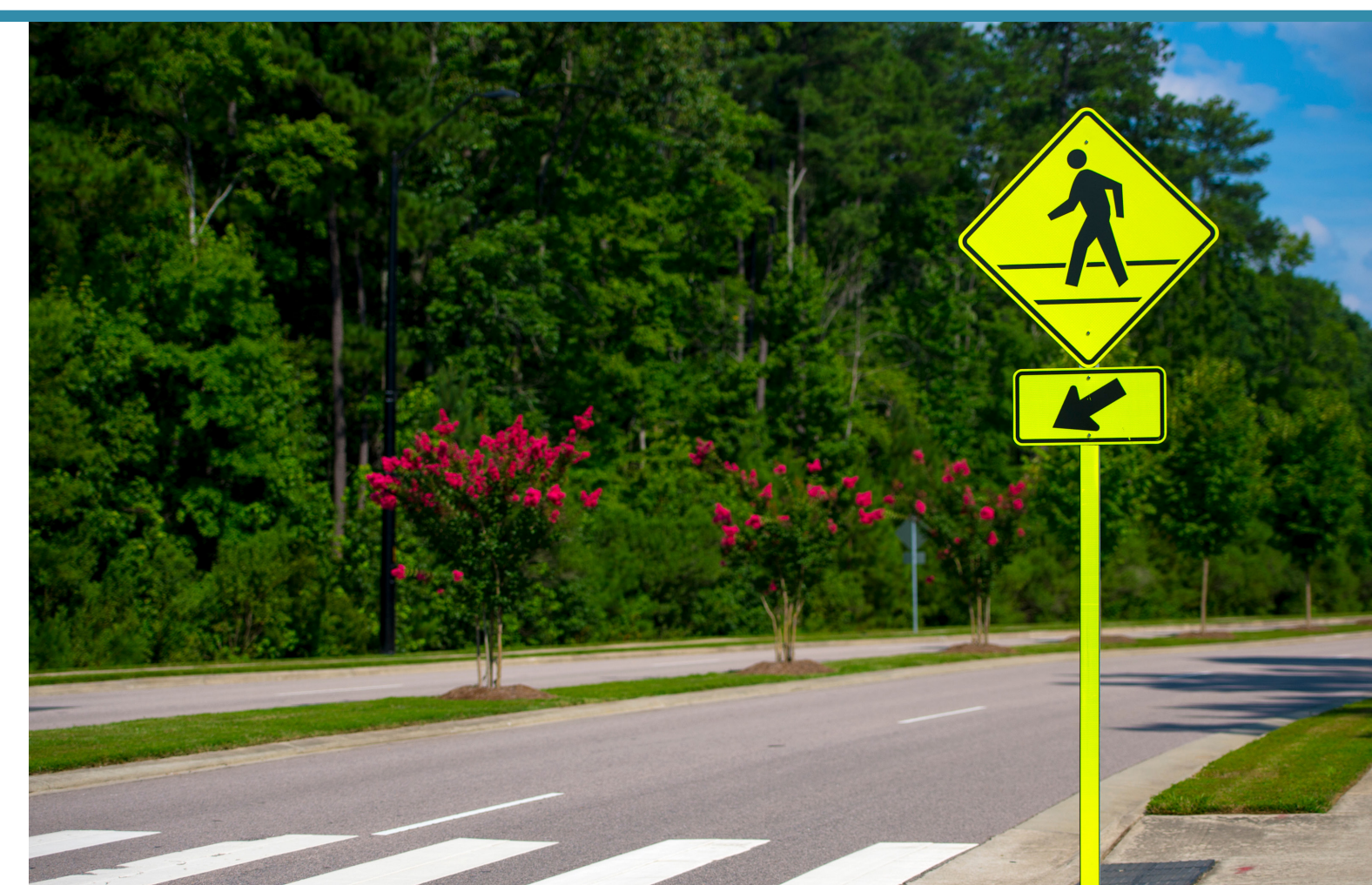
Painted Crosswalks & Signage Cruces y señalización pintadas