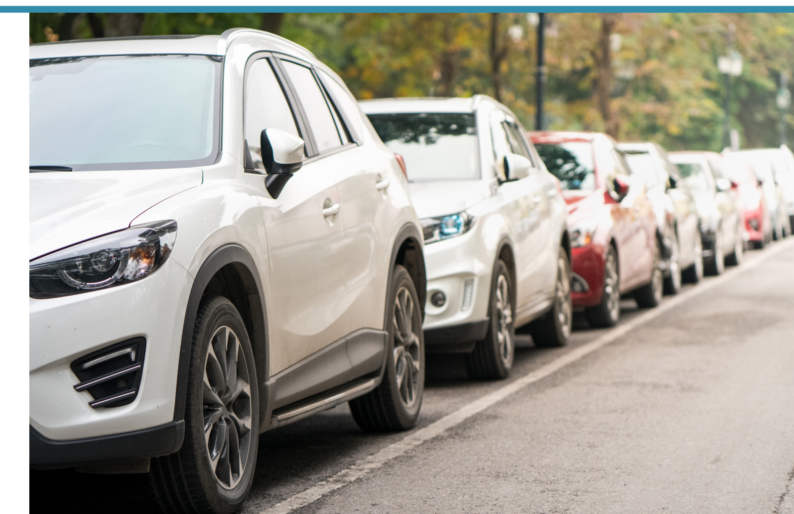
On Street Parking Estacionamiento en la calle