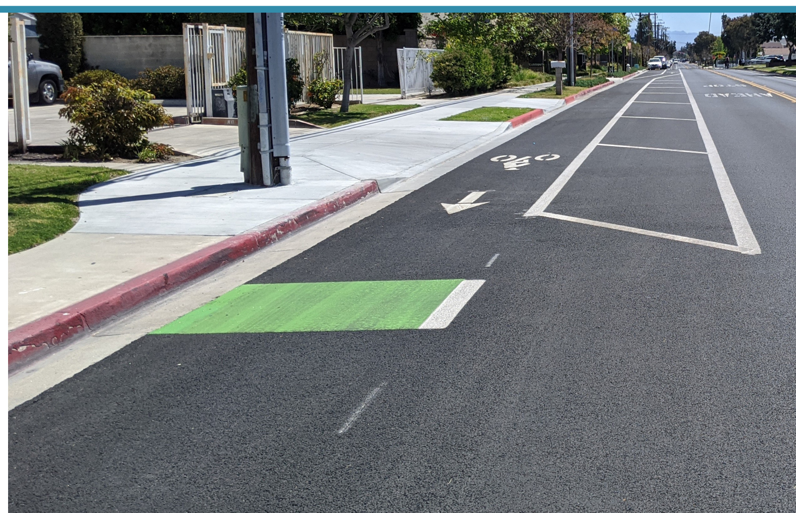
Designated Bike Lanes Carriles designados para bicicletas