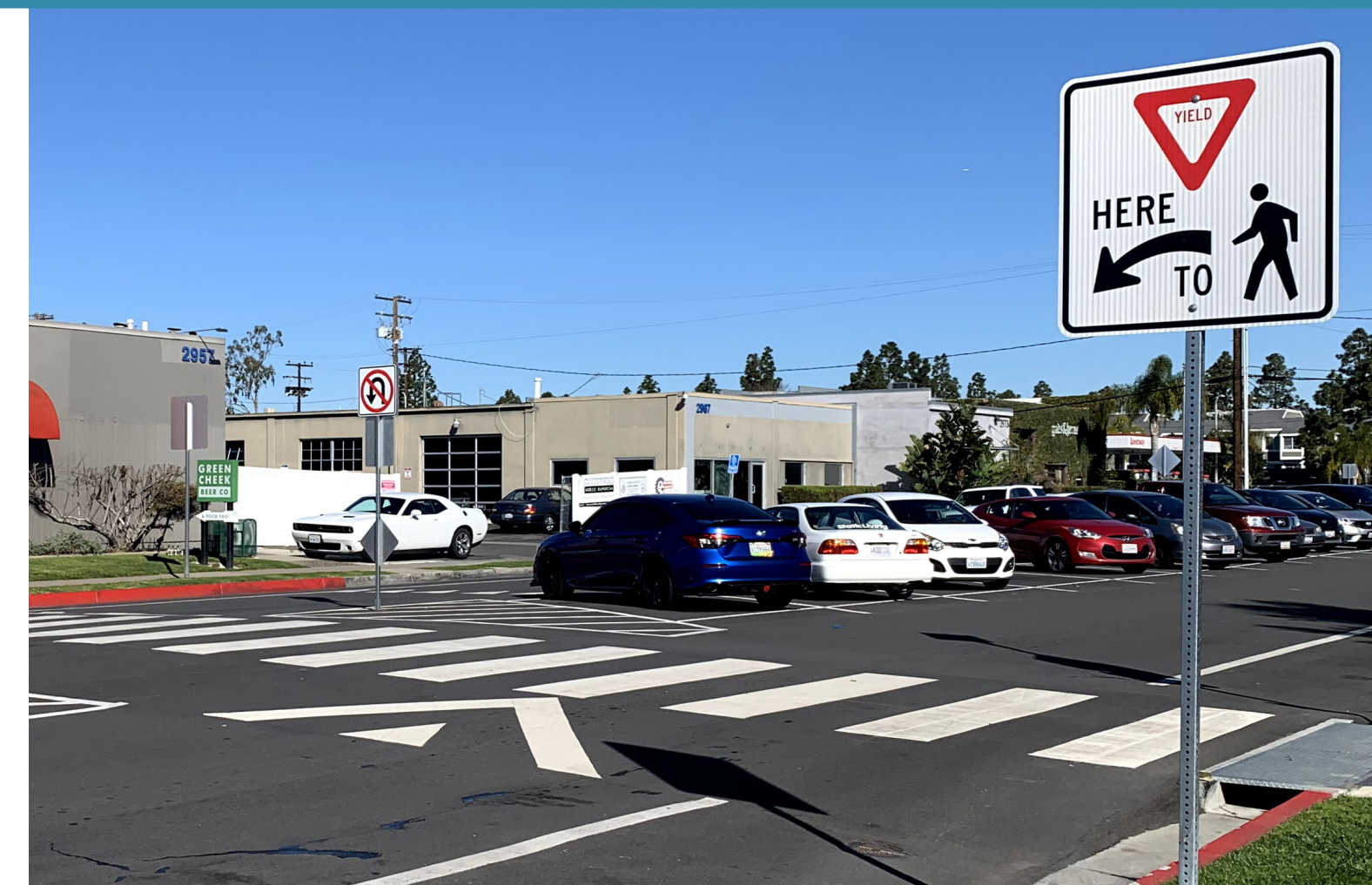
Raised Crosswalks Cruces peatonales elevados