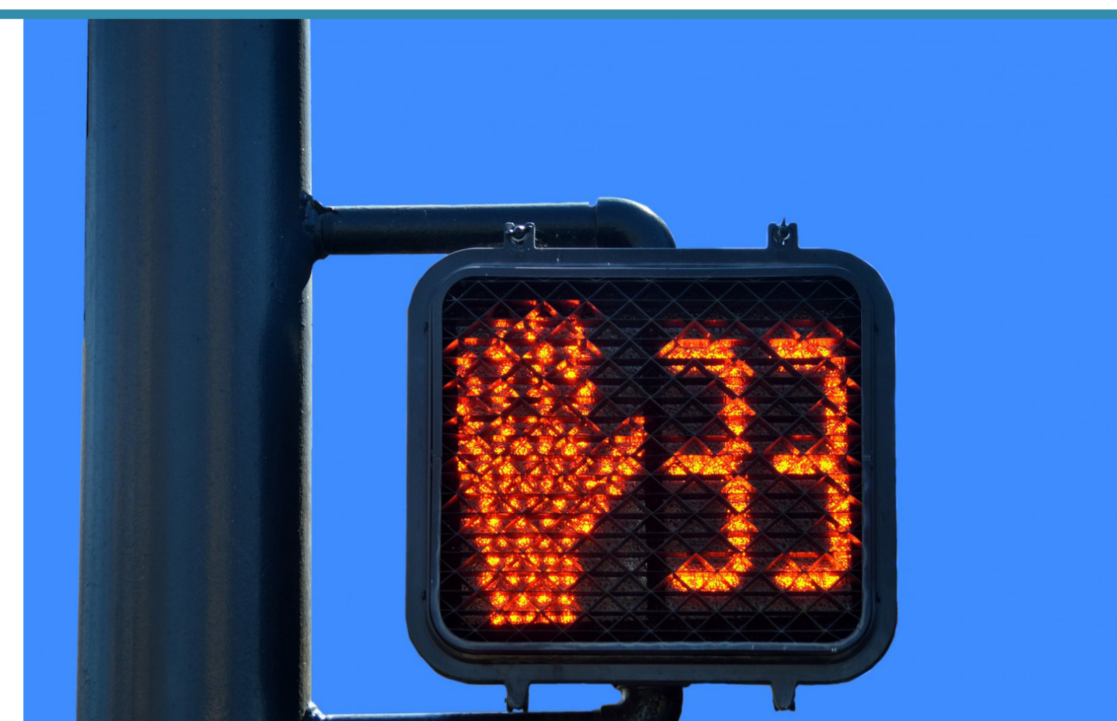
Pedestrian Countdown Heads Semáforo peatonal con conteo recesivo