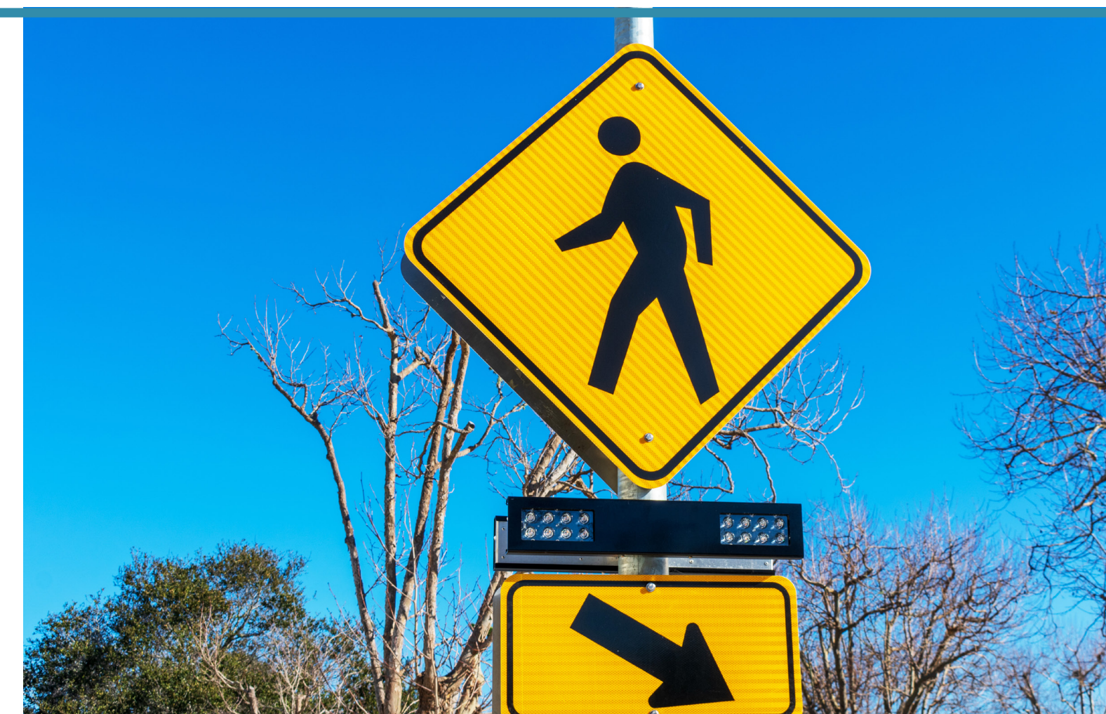
Flashing Pedestrian Crossings Cruces de peatones intermitentes